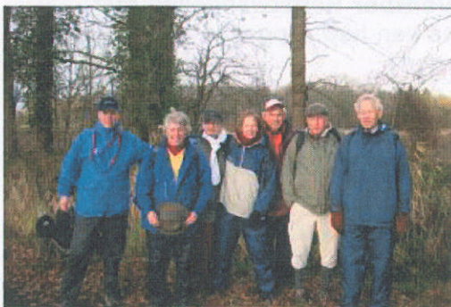
Wandeling oktober 2008