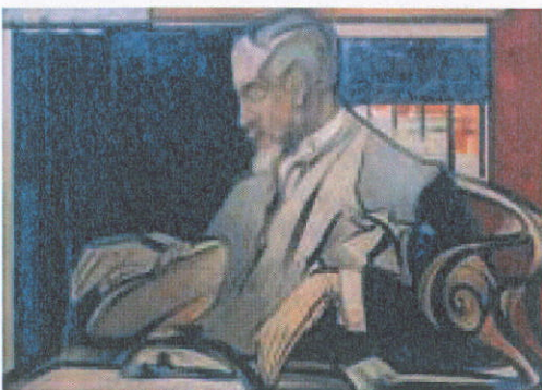
Portret Hugo Tutein Nolthenius

De tentoonstelling Hugo Tutein Nolthenius, Portret van een 'Delftsch' kunstverzamelaar, van medio september tot eind november 2008 in Museum Het Prinsenhof in Delft.