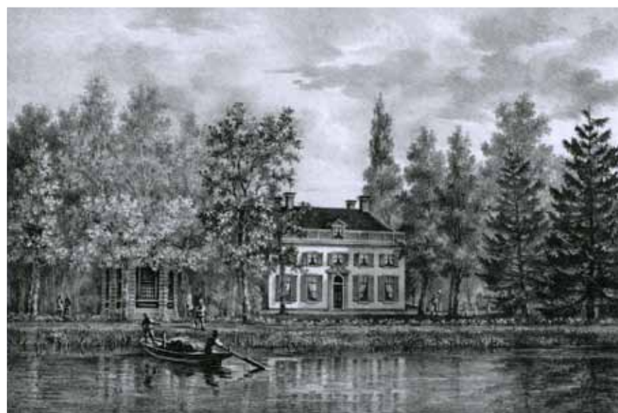
Boomoord, prent van P.J. Lutgers uit 'Gezichten langs de Vecht' (1836).