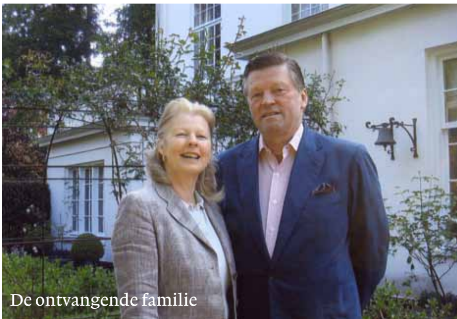
De ontvangende familie