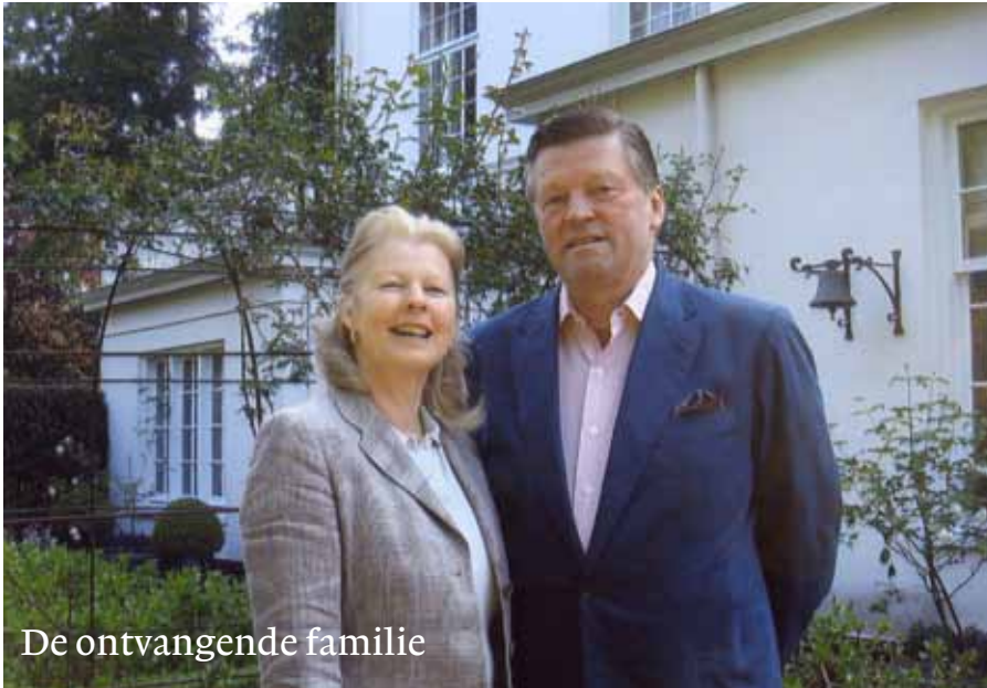
De ontvangende familie