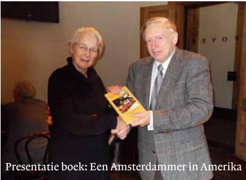
Presentatie boek: Een Amsterdamer in Amerika

Op 9 januari 2010 in Felix Meritis, Amsterdam.