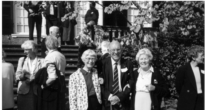
Zo maar wat gezellige gezichten.

Onze indruk werd versterkt door enige brieven; u heeft het een hele prettige dag gevonden. Vele onbekenden werden bekenden en vele oude vriendschappen werden versterkt. Hierbij het verslag van de voorzitter van het organisatiecomité.