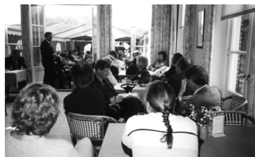
In de oranjerie

Honderd familieleden, jong, oud en daartussen, vierden op 16 September jl. reünie in de oranjerie van huis Verwolde nabij Lochem. Het was een zonovergoten nazomerdag, ontspannen, vrolijk en hartelijk.