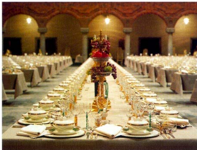
The magnificent Nobel table setting with pure linen table-cloths.