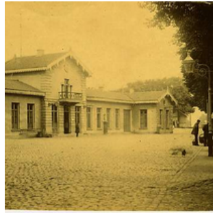
Eerste stationsgebouw van Delft aan de Houttuinen