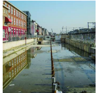
Aanleg spoortunnel in 2012