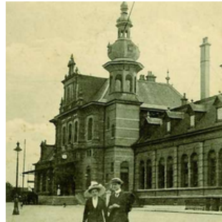
Stationsgebouw aan de Van Leeuwenhoeksingel